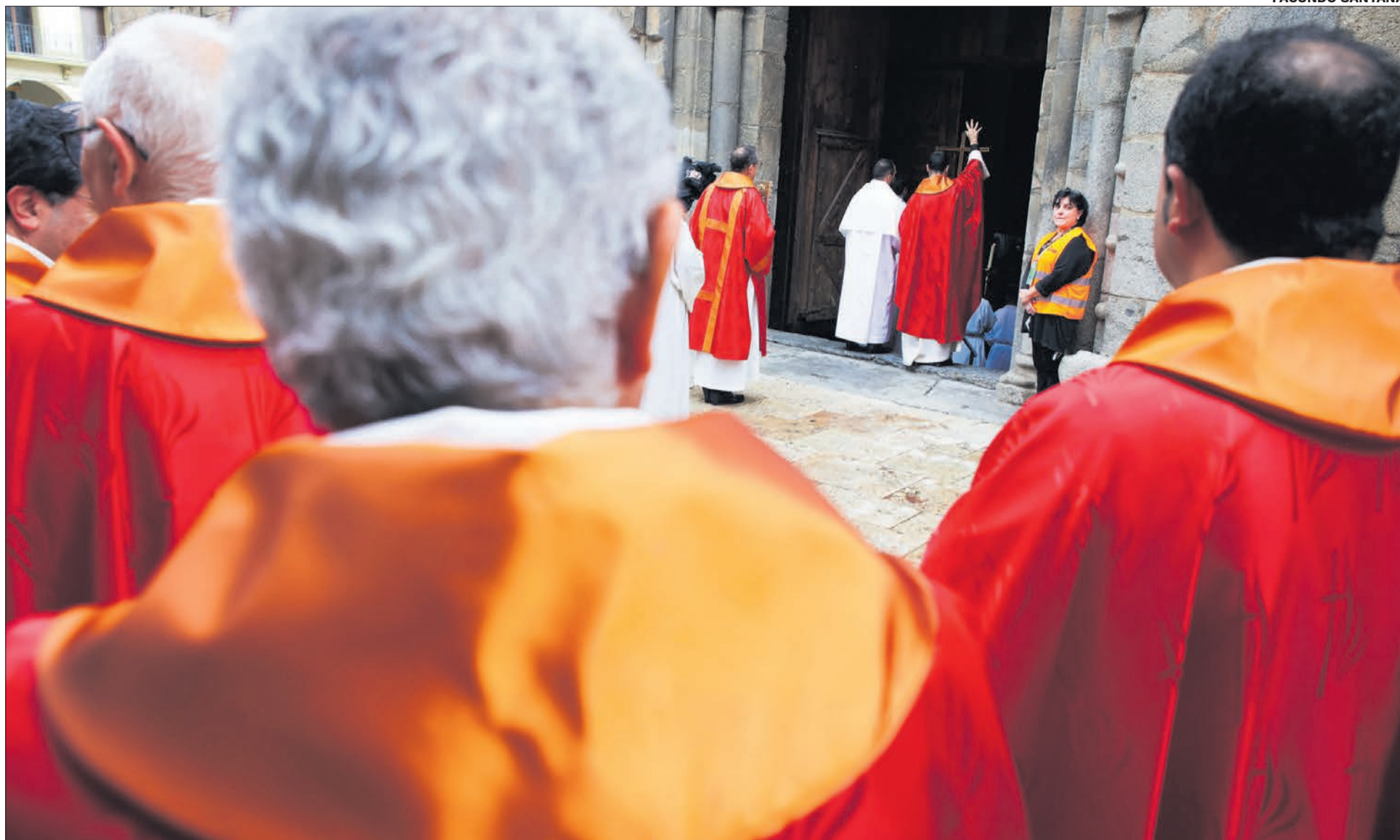
La processó de bisbes i preveres entra a la catedral per iniciar la cerimònia.