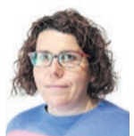
E. O. G. LA SEU D'URGELL