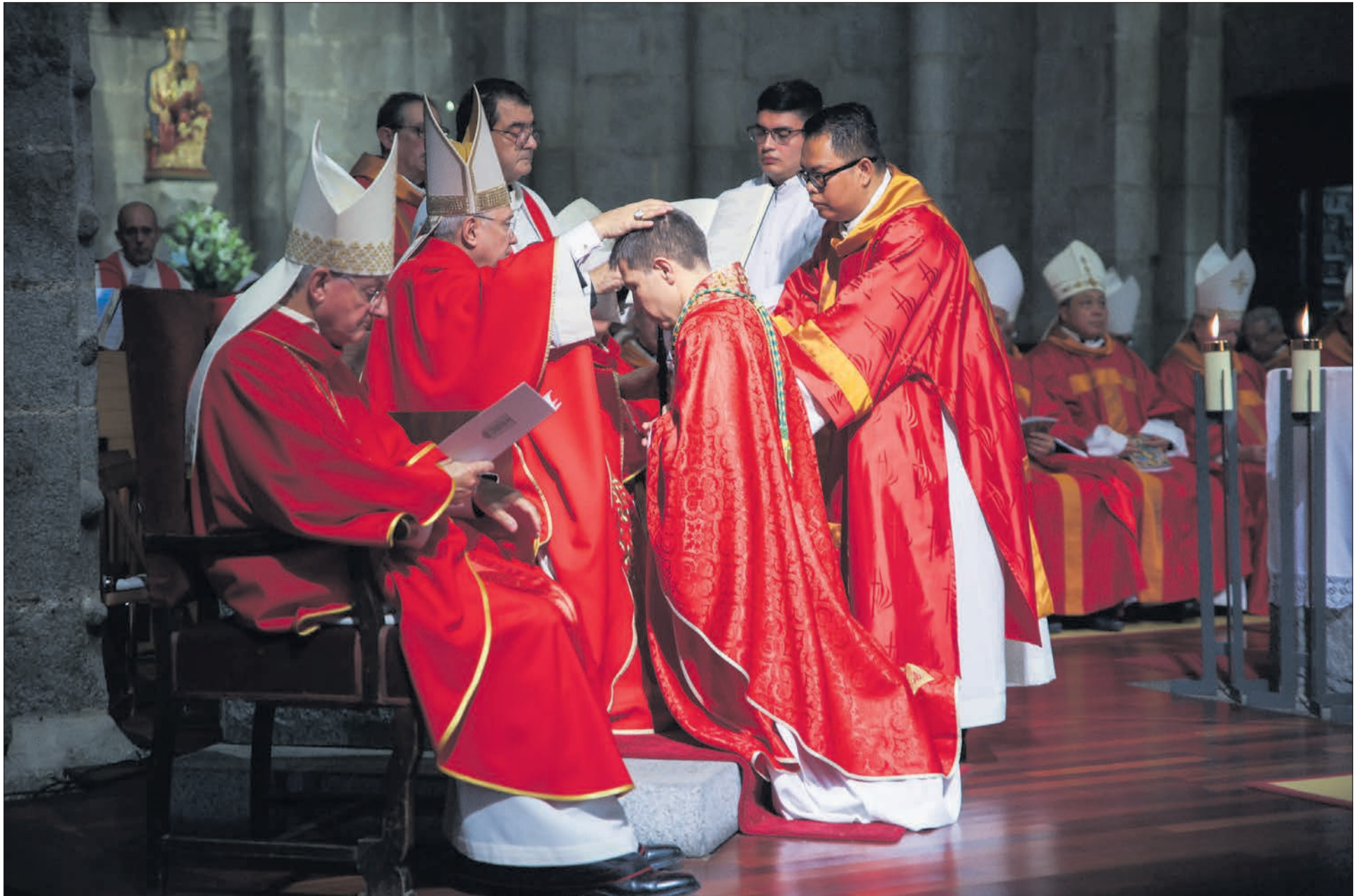
L'arquebisbe Edgar Peña imposa les mans al nou bisbe coadjutor.