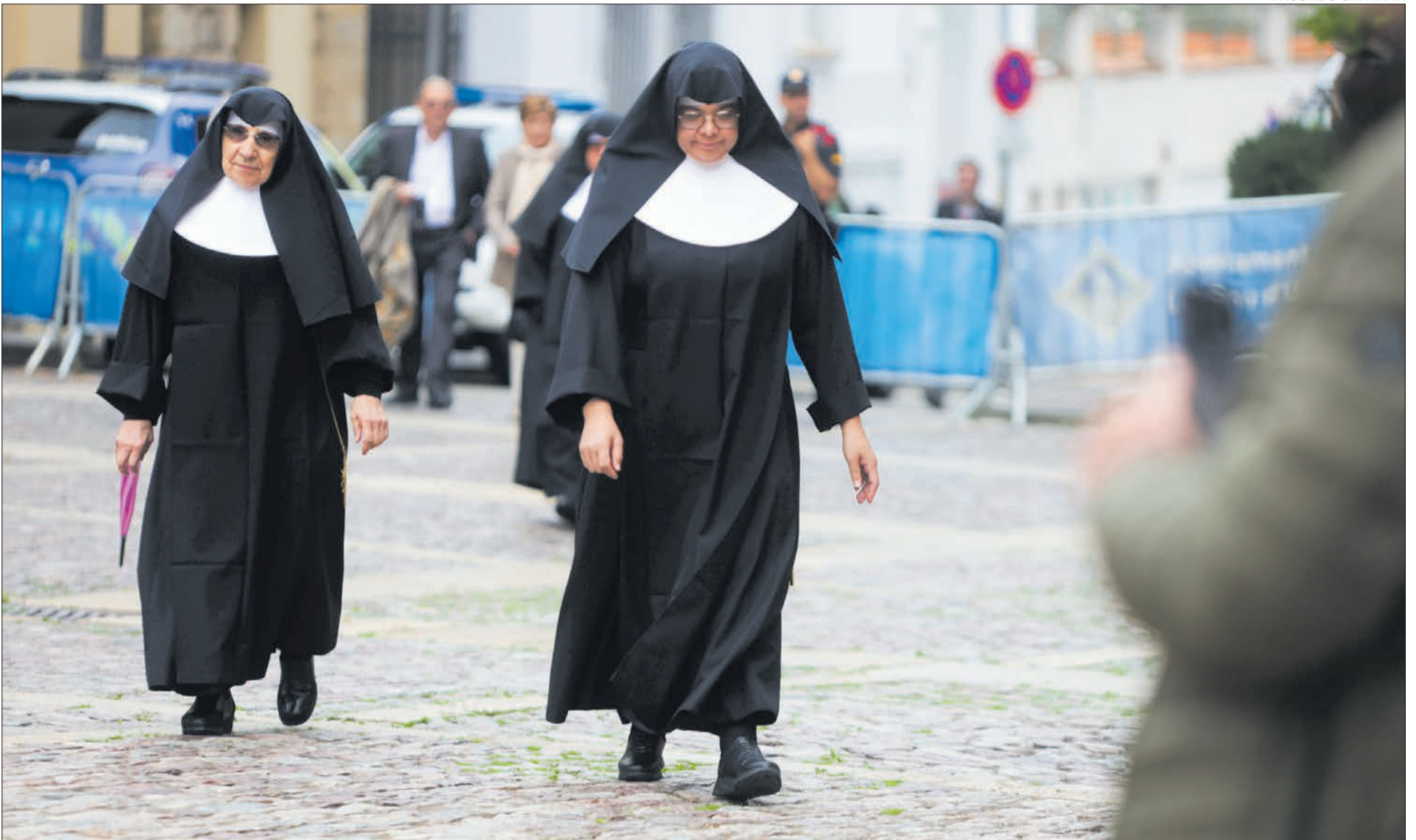
Unes monges arriben dissabte a la catedral per assistir a l'ordenació.