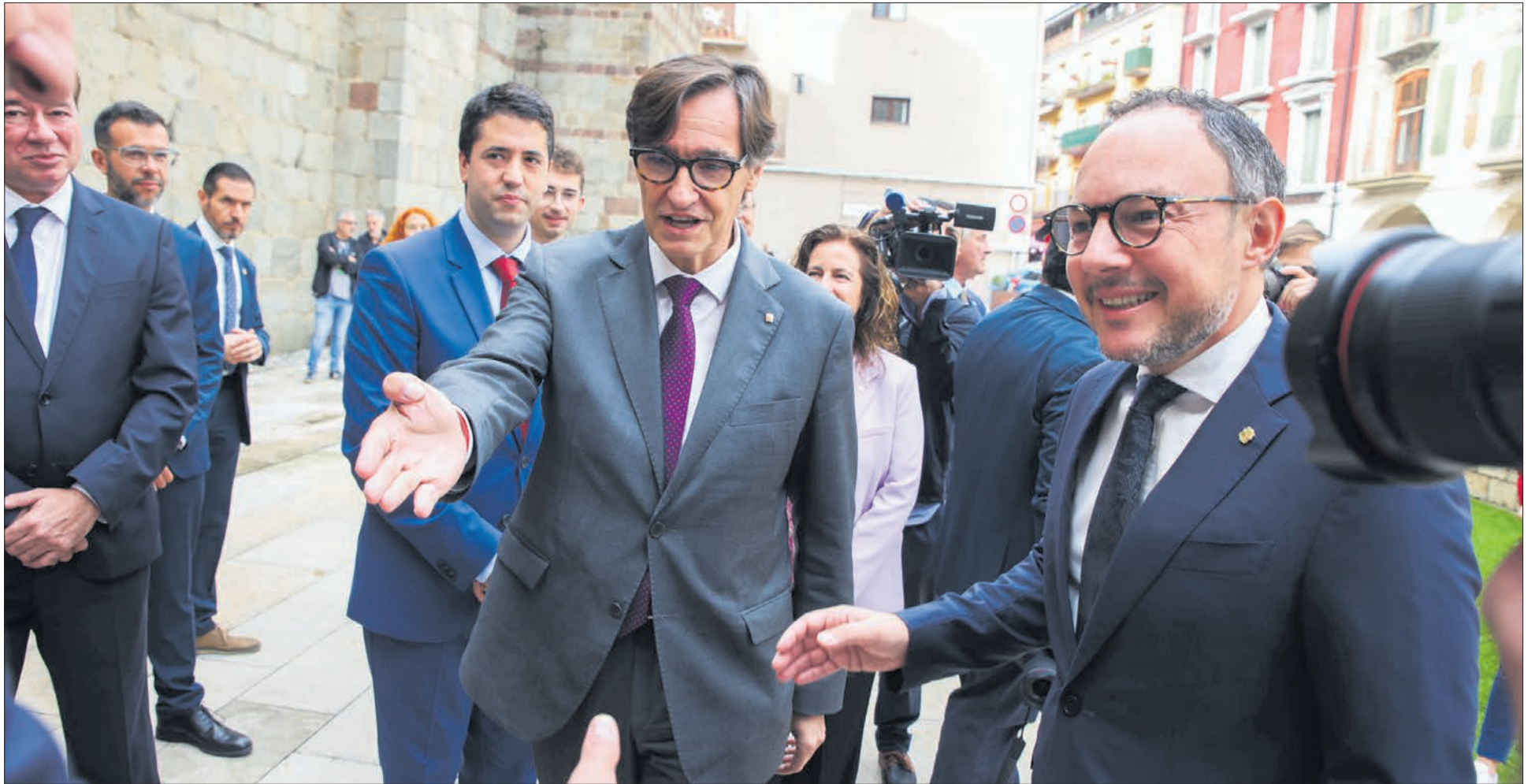
El cap de Govern, Xavier Espot, i el president català, Salvador Illa, ahir a la Seu d'Urgell just abans de començar la cerimònia.