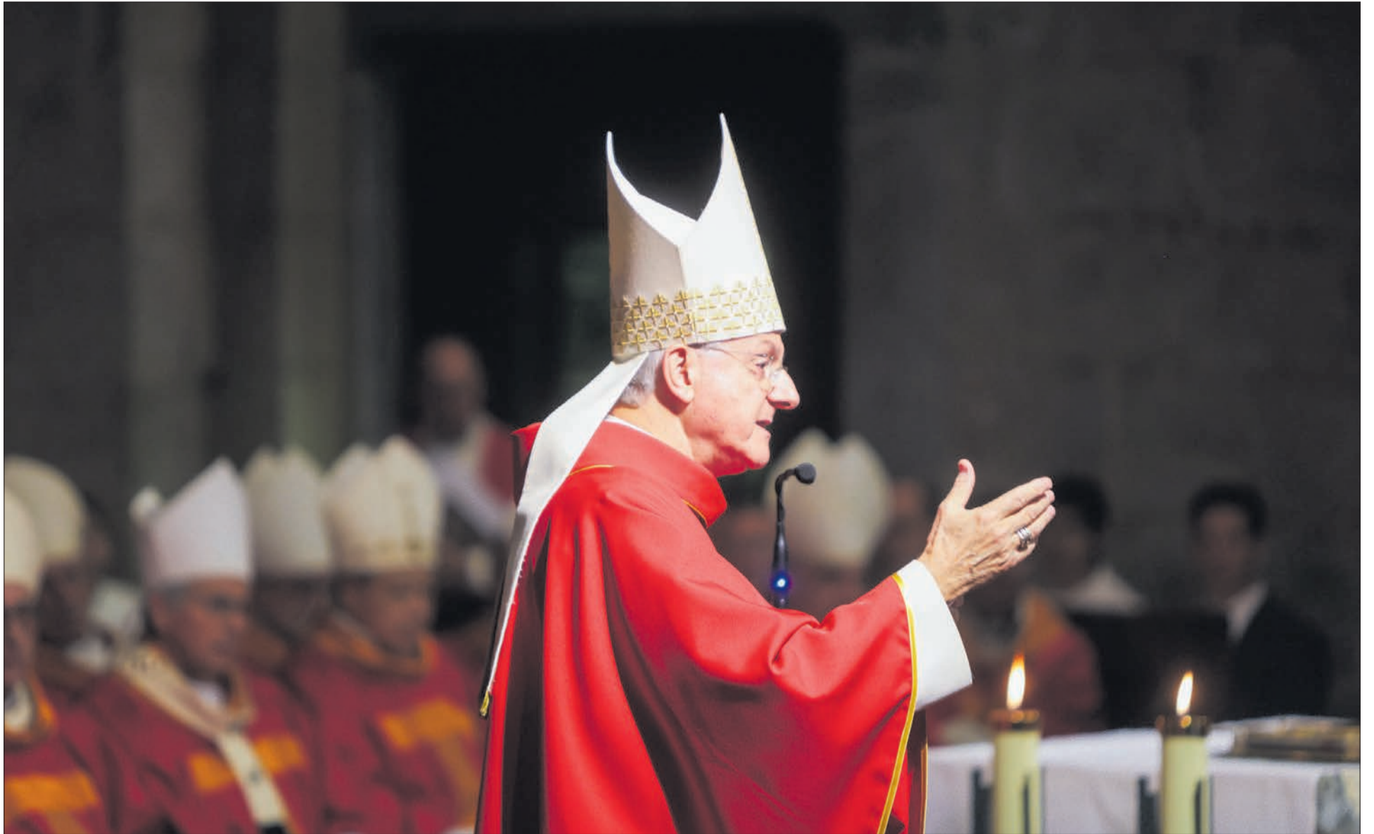
L'arquebisbe-bisbe d'Urgell i copríncep d'Andorra, Joan-Enric Vives, durant la seva salutació a l'inici de la cerimònia d'ordenació.