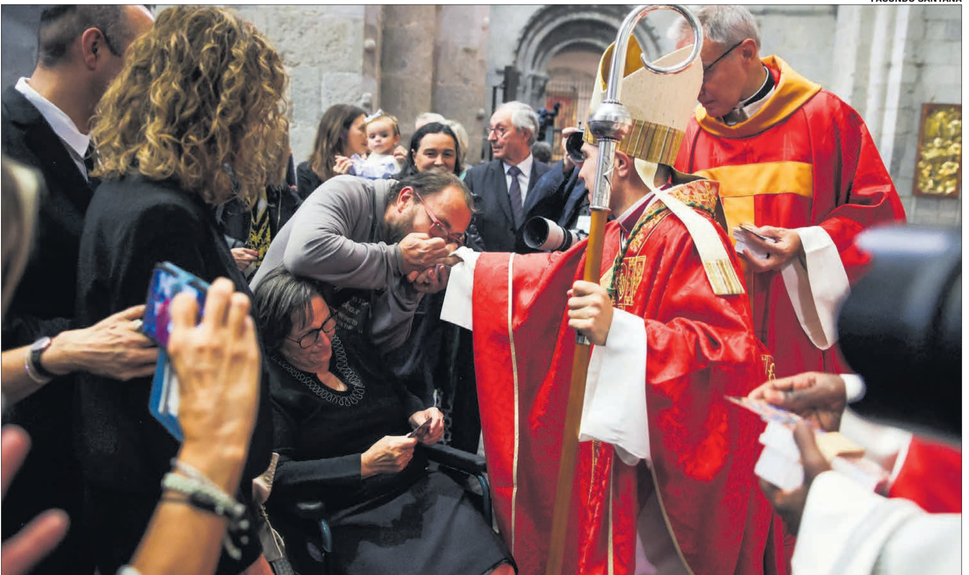
Just després de la cerimònia i abans de l'al·locució final, el bisbe Serrano va saludar els fidels que van assistir a l'ordenació: l'emoció salta a la vista.