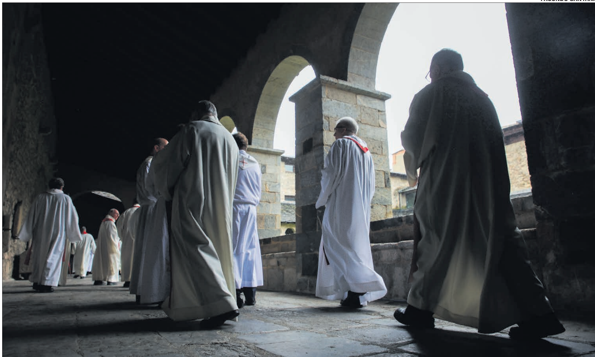
Els preveres surten de la catedral pel claustre.