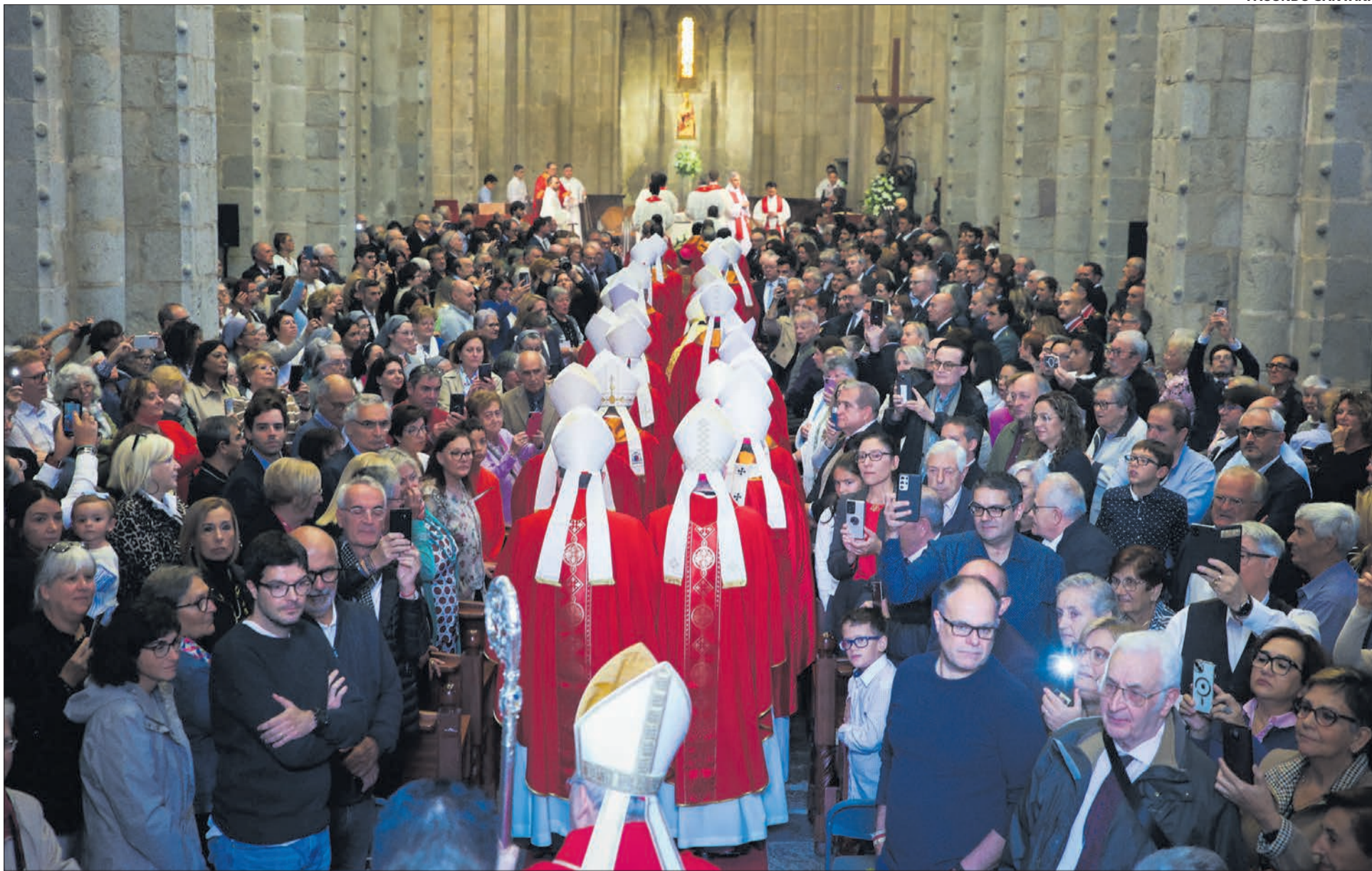
La desfilada de la trentena de bisbes per la nau central, una coreografia perfectament assajada i representada durant quasi dos mil anys.