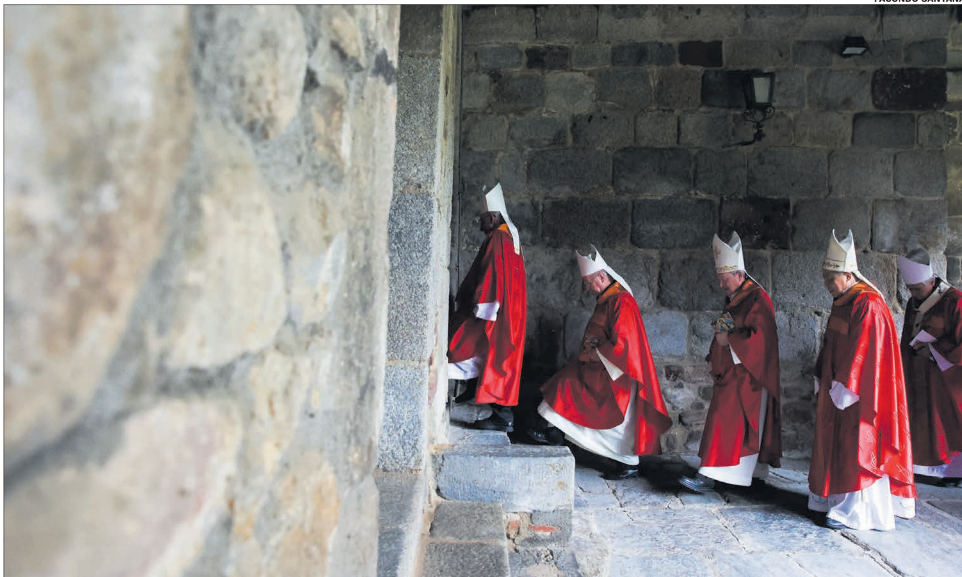
Bisbes en processó.