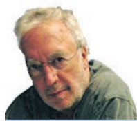
MARC FORNÉ EXCAP DE GOVERN (1994-2005)