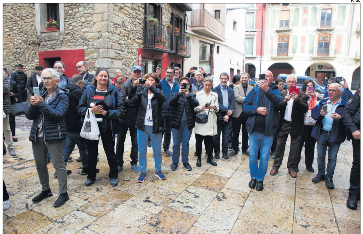
A la plaça dels Oms els curiosos anaven recollint l'arribada dels convidats i protagonistes.

gent vol rebre el sagrament. "Sort que hi ha molts també per repartir les hòsties", deixa caure el nostre interlocutor. Com que sabem que ho reproduïrem a la crònica, marxem del seu costat, que un dia acabarem excomunicats. O acomiadats, que és pitjor. El matí ja s'ha convertit en tarda i comencem a entrar en els capítols finals. El ja nou bisbe fa la volta a la catedral i al seu pas els flaixos es desapareixen igual que amb Cate Blanchett arribant al festival de Donosti. Amb l'avantatge que d'aquí surts beneït. Fora segueix plovent i, prevenint la sortida de les autoritats, els de