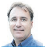
A. BELIS LA SEU D'URGELL

Considera que les “qualitats humanes” el fan “idoni” per ser bisbe i copríncep