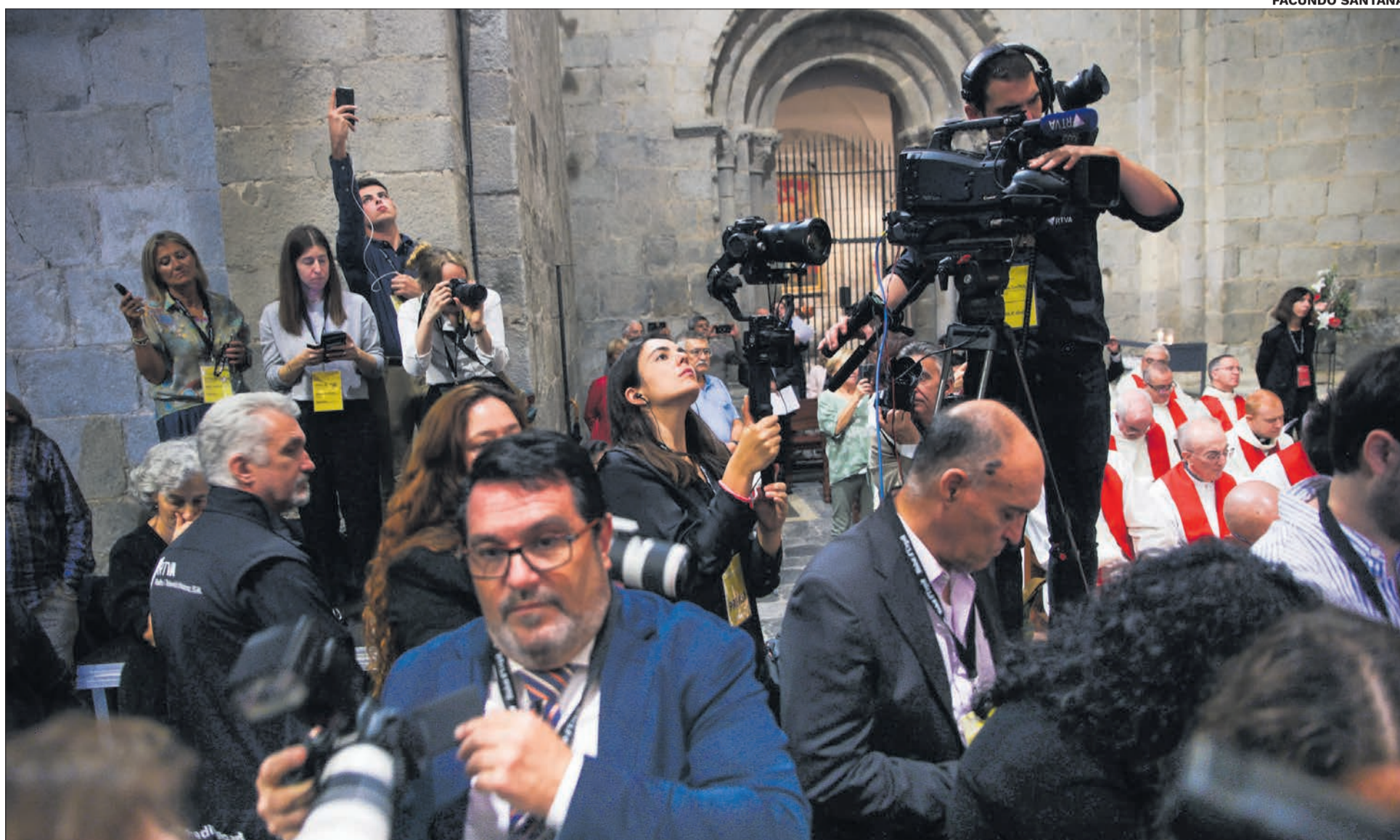
Periodistes, fotògrafs i càmeres de televisió esforçant-se per capturar l'històric moment.