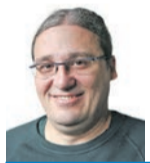
M. S. ANDORRA LA VELLA

“Gràcies Josep-Lluís per haver respost sí a la crida que a través del Sant Pare Francesc i els seus col·laboradors el mateix Crist t’ha enviat”. Amb aquestes paraules es va dirigir l'arquebisbe-bisbe d'Urgell i copríncep d'Andorra, Joan-Enric Vives, a Josep-Lluís Serrano Pentinat, en l'obertura de la cerimònia d'ordenació del prevere tortosí com a bisbe, de qui es va mostrar convençut que “no només serà un bon copríncep, sinó també un bon pastor”.