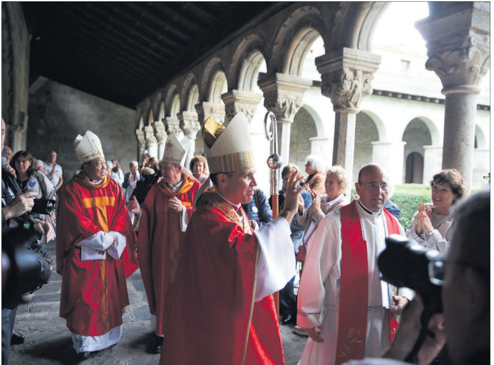
Després de la cerimònia, i abans de l'al·locució, el nou bisbe va desfilat per les naus de Santa Maria i pel claustre per beneir els congregats.

i pau, tot cercant sempre el bé comú del nostre poble; per servir-vos com no en monsenyor Vives, que caminem junts pels senders de la nostra estimada Església urgell-litana”.