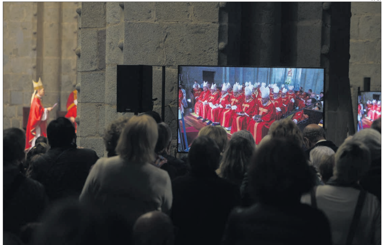
A la catedral no entrava ja ni l'agulla de l'ull per on passaria abans un camell que un ric entrés al regne dels cels.