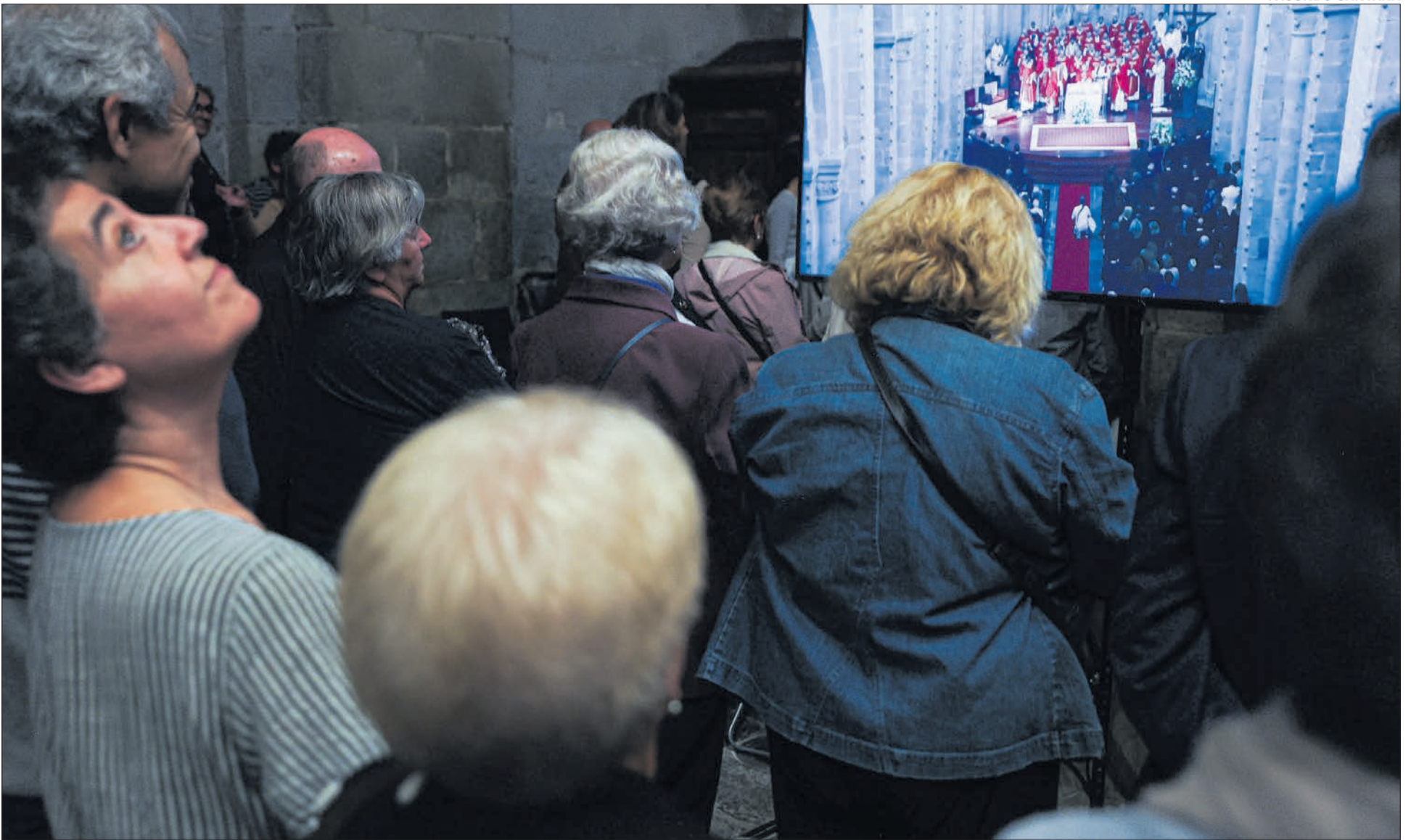
Un grup de fidels segueixen la cerimònia a través de les pantalles instal·lades pel recinte.