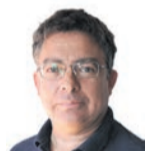
LA SEU D'URGELL